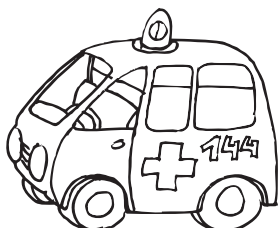
der Krankenwagen der Rettungswagen